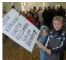
Vor der St.-Bartholomäus-Kirche sammelten sich...