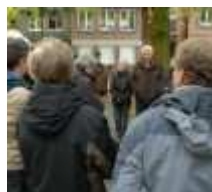
Vor der St.-Bartholomäus-Kirche sammelten sich...